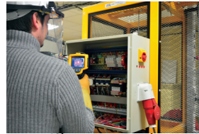
L'électronique, les systèmes numériques et réseaux

Des énergies Des métiers L'énergie, votre emploi de demain