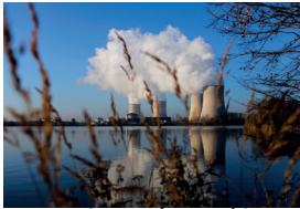
Les métiers du nucléaire