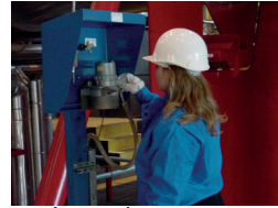
La maintenance industrielle